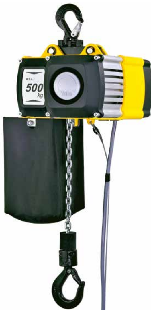
Abgebildeter Kettenspeicher optional lieferbar