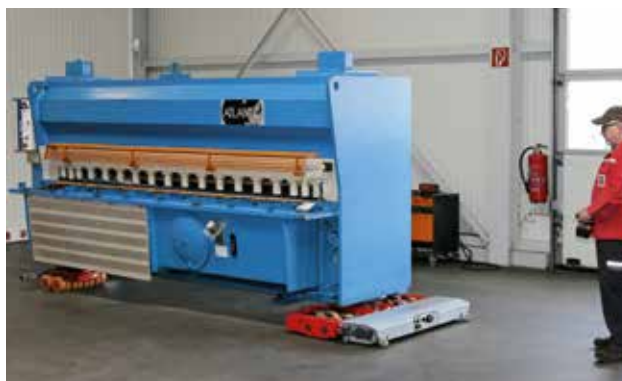
bis zu 30t spielend einfach bewegen