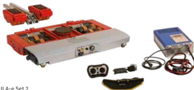
JLA-e Set 2