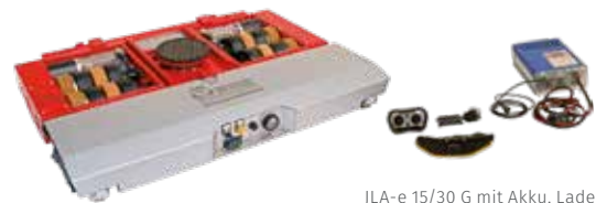
JLA-e 15/30 G mit Akku, Ladegerät, handliche Funkfernsteuerung und Gürtel mit Halterung!