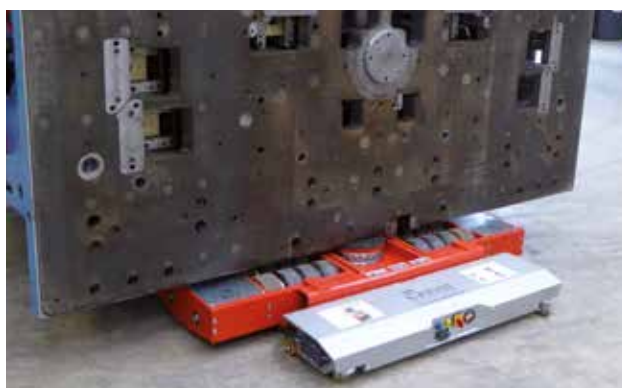
JLA-e 25/50 H in Aktion