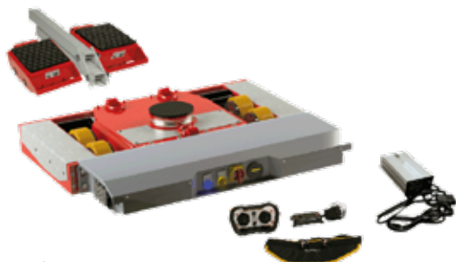
JLA-e Set 1