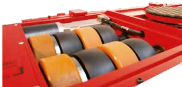
Kombination aus JUWathan®- und JUWamid-Rollen für optimale Traktion und Lenkeigenschaften